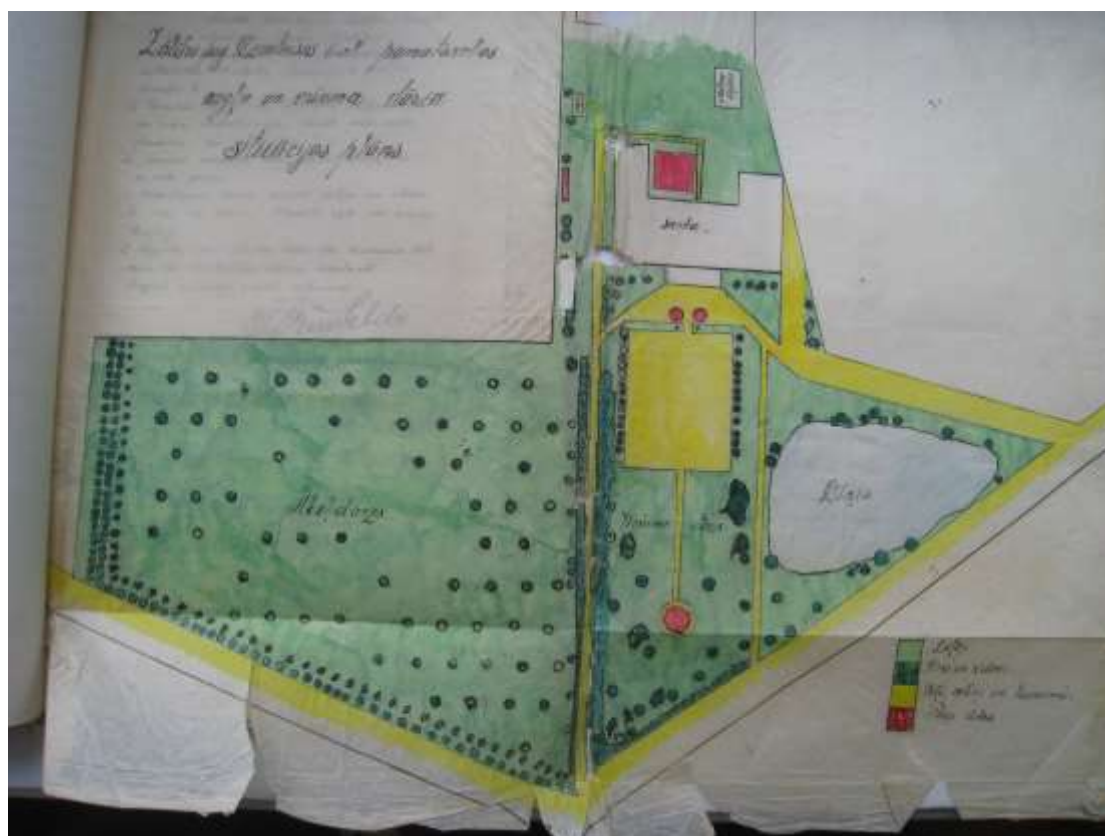
LLI-313 «Aizraujošs ceļojums muižu parkos četros gadalaikos»/ «4SeasonsParks»