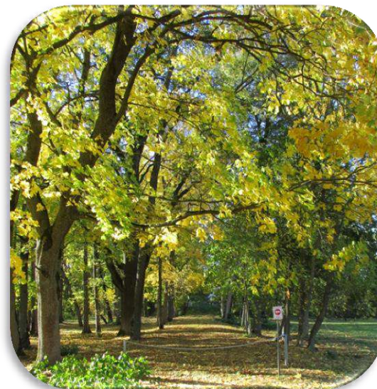
Bramberges muižas apbūve ar parku (Valsts aizs. Nr. 5205)