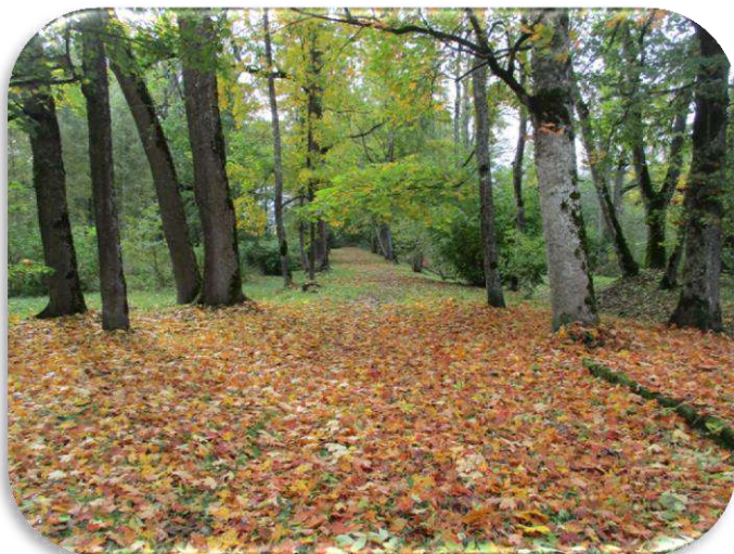
Parks (Valsts aizs. Nr. 4897) Dobeles novads, Bikstu muiža.