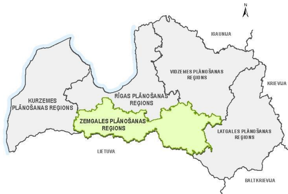
Attēls Nr.1 – Zemgales plānošanas reģiona izvietojums (gaiši zaļā krāsā) Latvijas kartē

Zemgales plānošanas reģions atrodas Latvijas centrālajā daļā uz dienvidiem no Rīgas, sākot no Austrumkurzemes augstienes un Dienvidkurzemes zemienes rietumos līdz Augšzemes augstienei austrumos, bet tā centrālā daļa atrodas Zemgales līdzenumā.