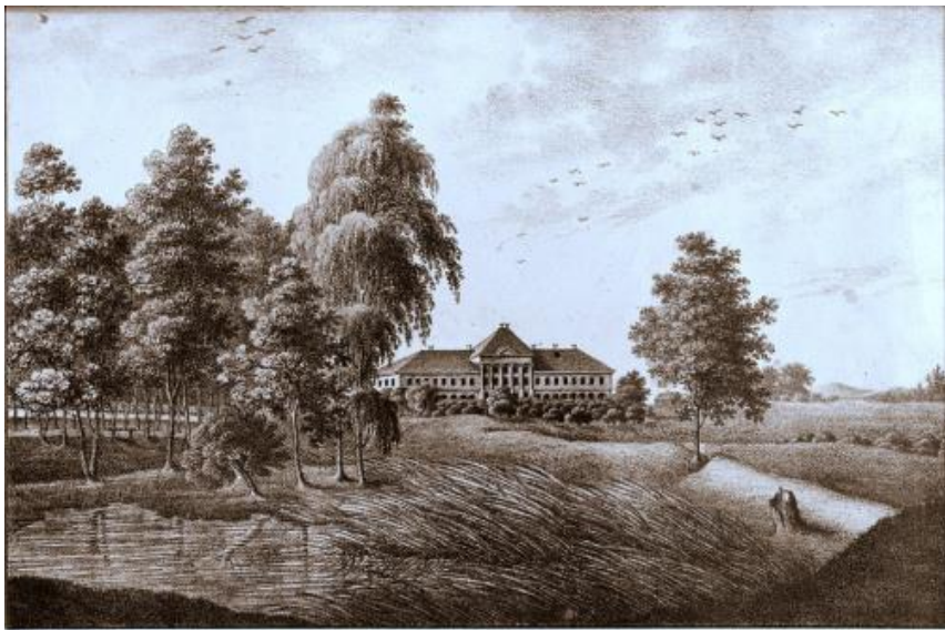
gerichtet von Menckeldi Lith. von Krause Sveithoff