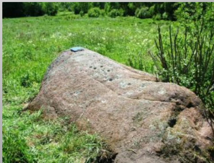
Kalnalammiku apmetne un Upurakmens - kulta vieta