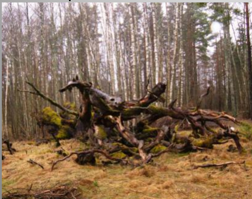
Ķuņķu Svētozols viduslaiku kapsētas teritorijā