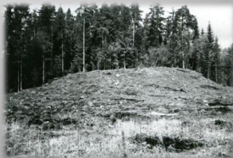
Panderu Upurkalns un Upurakmens- kulta vieta