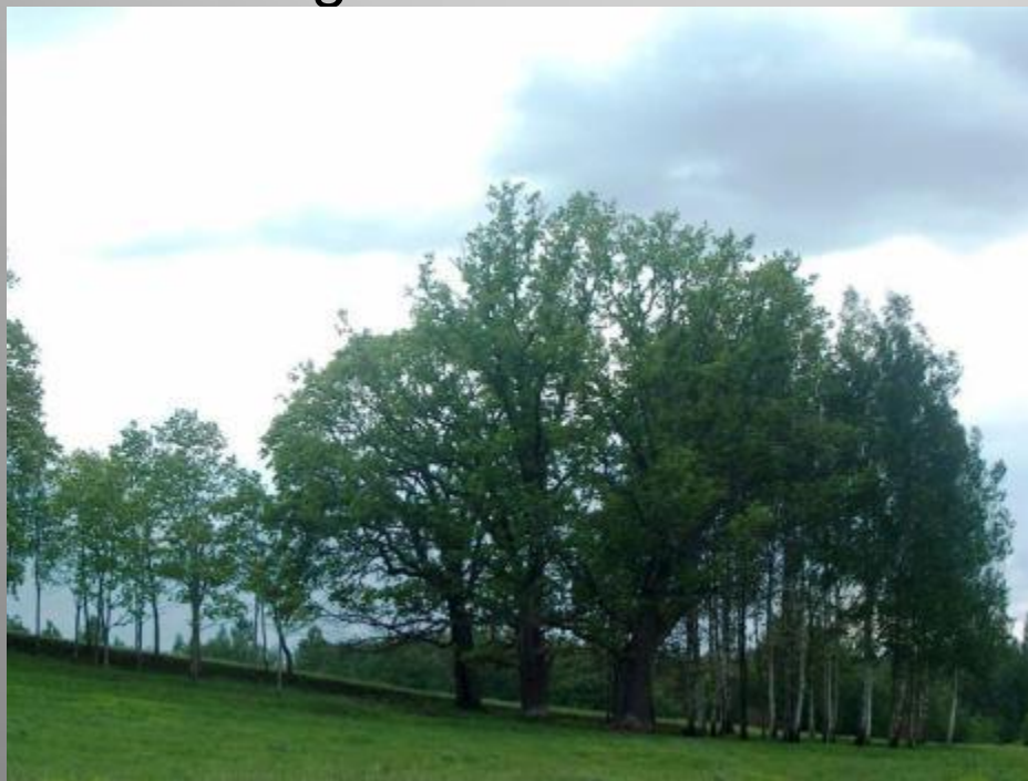
Juru Upurozoli- kulta vieta