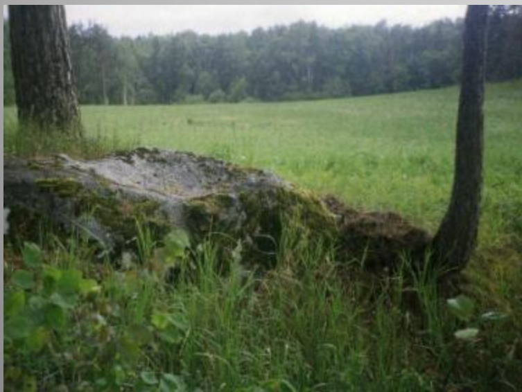
Līgu senkapu un kultakmens