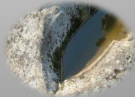
Meļķitāru Muldas akmens- kulta vieta