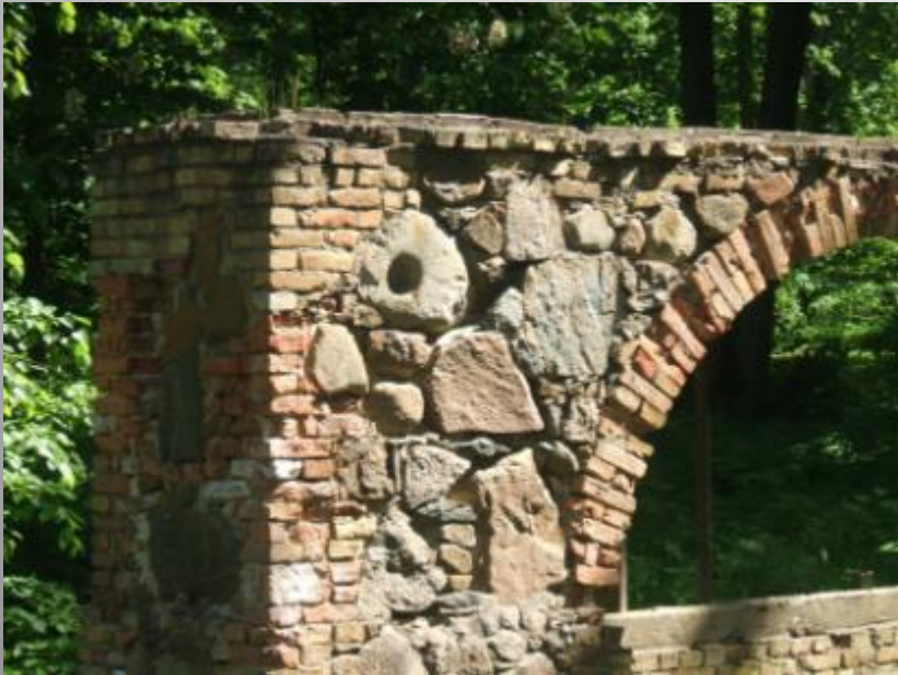
Elejas muižas dobumakmens- kulta vieta