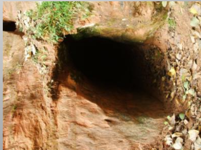
Lībiešu Upuralas- kulta vieta