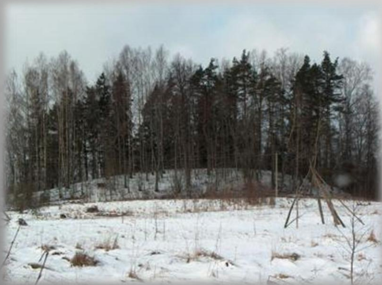
Upurkalniņš- kulta vieta