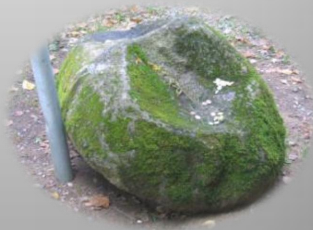
Zilais kalns ar Upurakmeni- kulta vieta un viduslaiku kapsēta