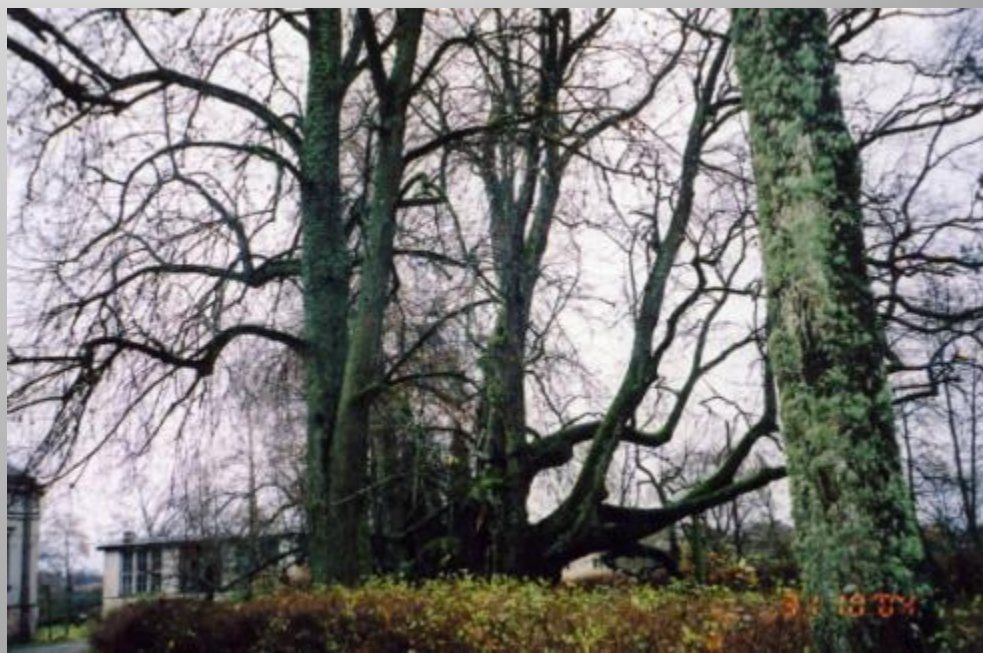
Valdemārpils Elku liepa